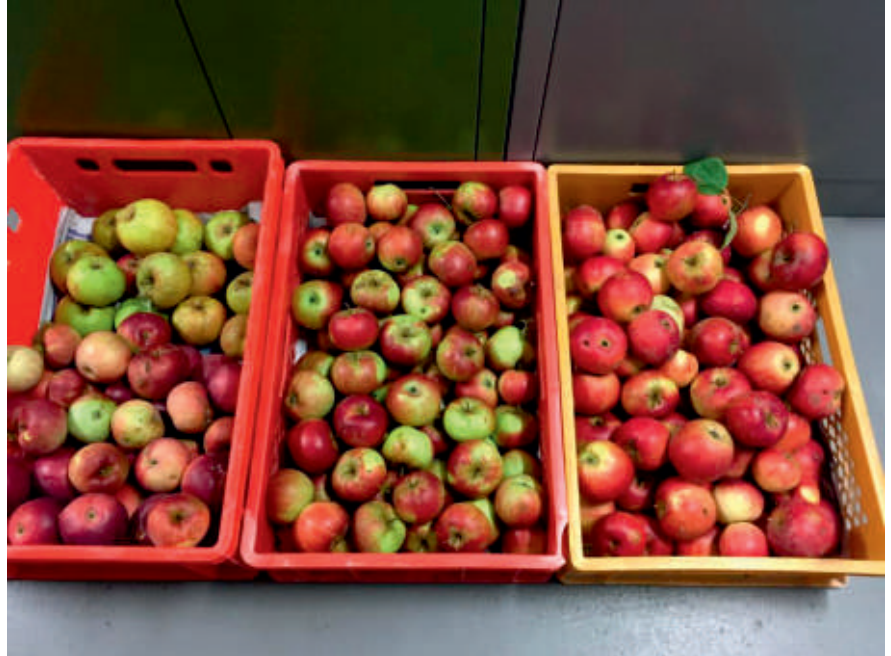
Eigene Auswahl der Ernte

erhielten zum Dank leckeren Apfelsaft für das ganze Haus. Gemeinsam mit dem Verein sind noch andere Projekte geplant. So soll auf dem Grundstück zum Beispiel ein Baumhaus für die Kinder entstehen, die dort regelmäßig zu Besuch sind und unsere Handwerker sind schon in der Planungsphase.