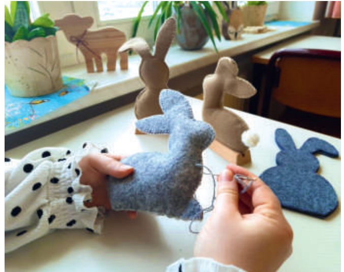
Die Ergotherapie ist im Osterhasenzauber.

Während dieser Zeit entwickelte ich ebenso viele Ideen und die Lust diese auszuprobieren. Schnell fanden sich interessierte Mieter, welche sich ebenso auf neue Herausforderungen freuten und probierten sich gemeinsam mit mir in der Herstellung von Exponaten für unsere Märkte im Rahmen der Öffentlichkeitsarbeit der Einrichtung aus. Schnell waren auch hier die letzten Zweifel ausgeräumt und ich fand mich mit 4 Klienten beim Nähen von Osterhasen an einem Tisch wieder. Viele interessante Gesprä-