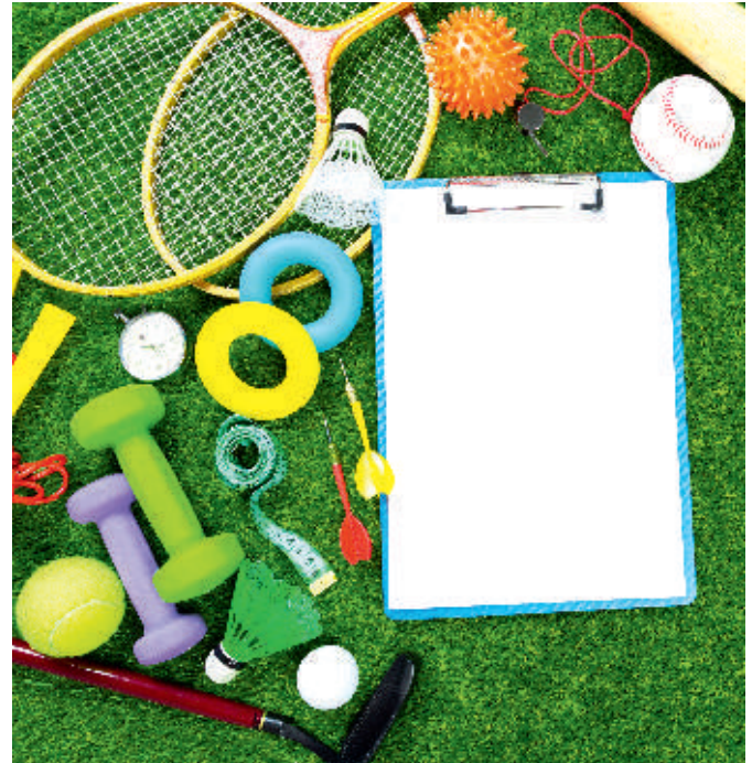
Fit in den Sommer

So haben wir die Möglichkeit, kleine Gruppen auch außerhalb des Sportraumes parallel zu betreuen und mobile Sportgeräte zu nutzen. Steppbretter ersetzen das Treppensteigen und bringen den Kreislauf in Schwung,