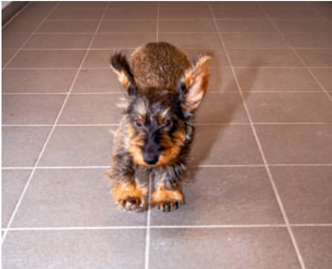
Kicky vom Ziegelberg = Seelenhund